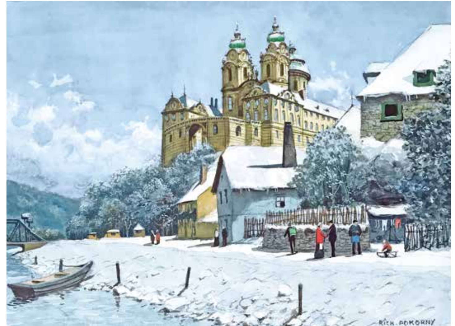
RICHARD POKORNY Wien 1907 – 1997 Wien Melk im Winter Aquarell / Gouache auf Papier signiert 25 x 34 cm