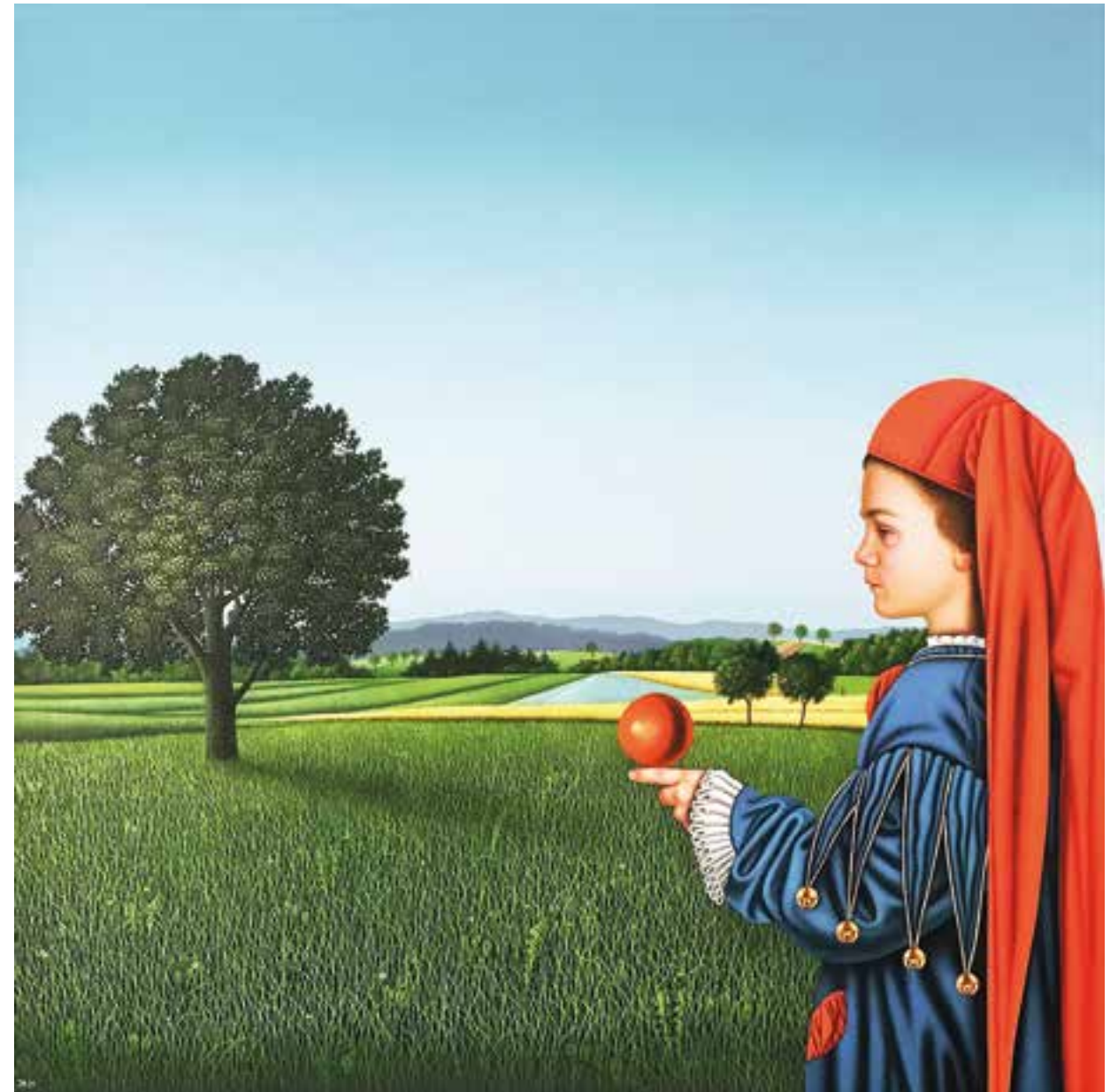
JOSEF BRAMER geboren 1948 Wien Junger Kaspar vor Sommerlandschaft Öl auf Leinwand monogrammiert und datiert (20)21 70 x 70 cm (mit Objektrahmung: 100 x 100 cm)