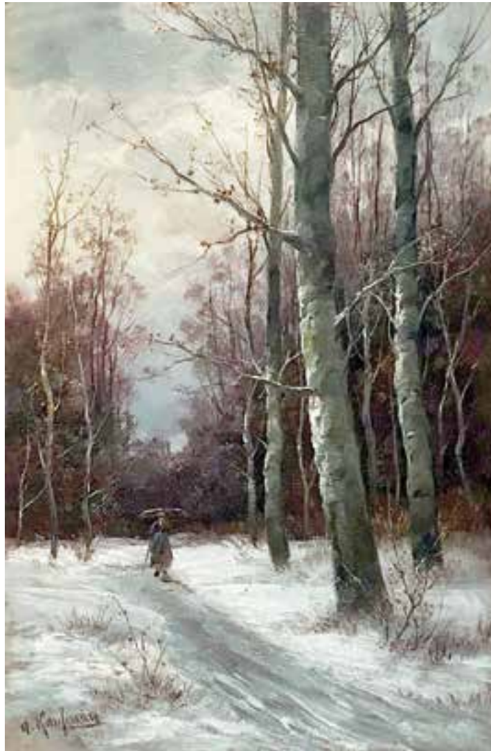
ADOLF KAUFMANN Troppau 1848 – 1916 Wien Winterlandschaft Öl auf Holz signiert 31 x 20,5 cm