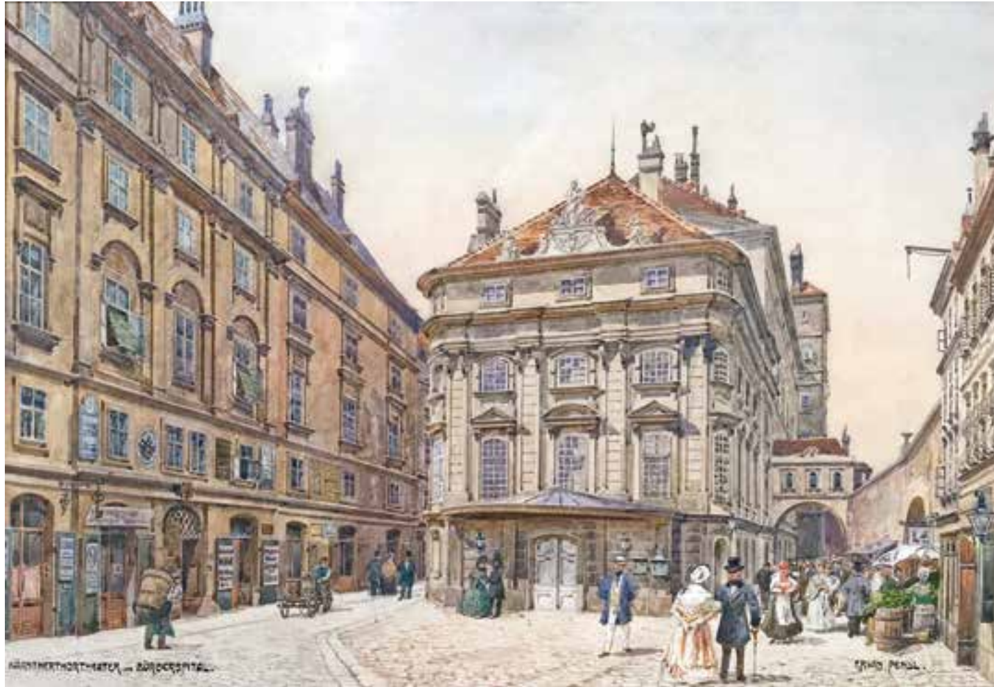
ERWIN PENDL Wien 1875 – 1945 Wien Kärntnertheater und Bürgerspital Aquarell auf Papier signiert und bezeichnet 23 x 33 cm