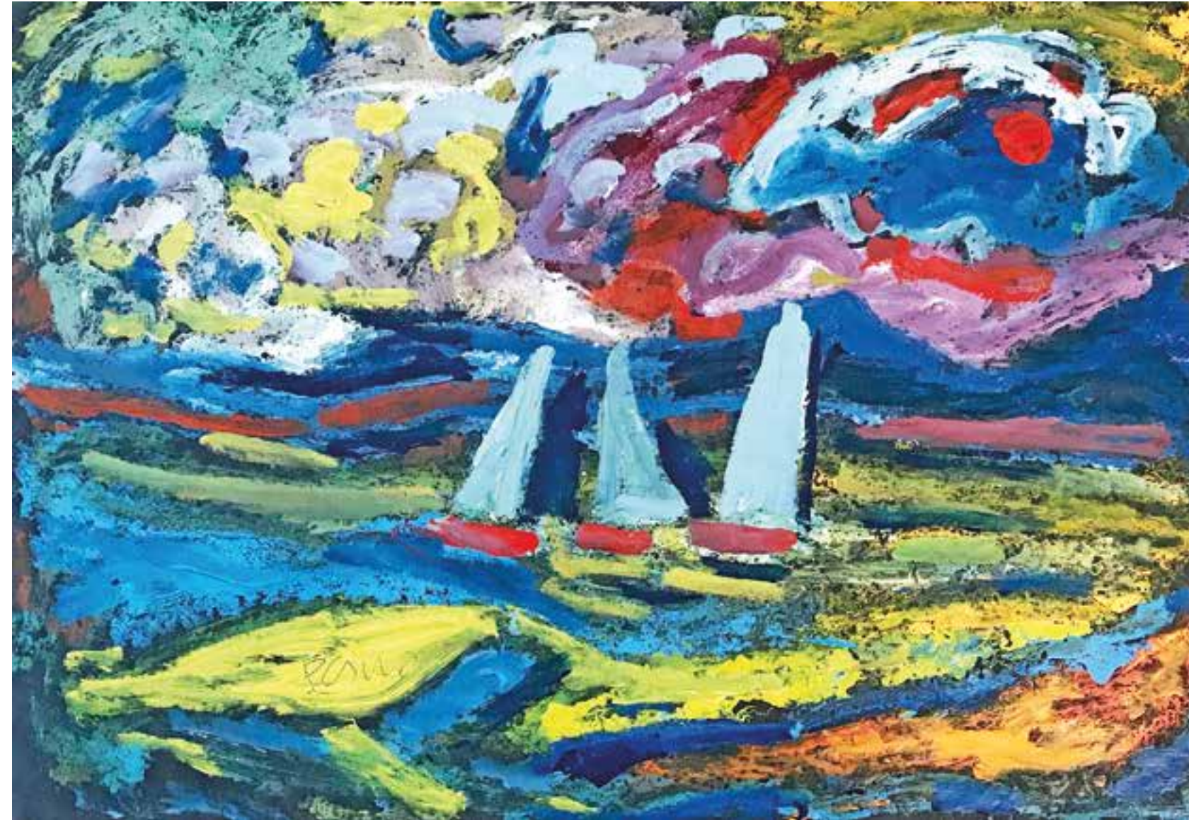
MIKLÓS NÉMETH Budapest 1934 – 2012 Budapest Segelboote am Plattensee Öl auf Farbkarton signiert, WVZ. Nr. 3169 69,8 x 99,2 cm