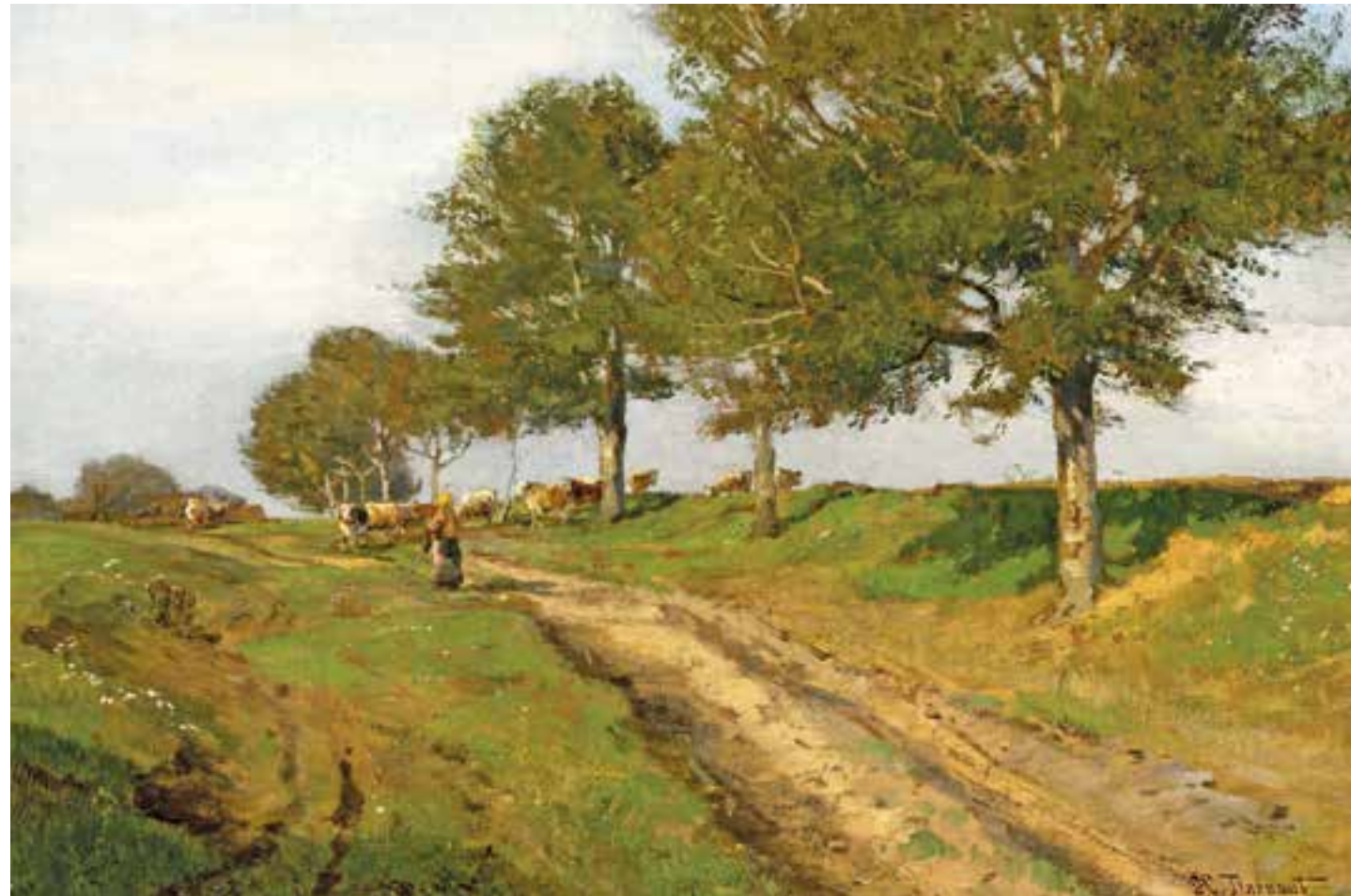
HUGO DARNAUT Dessau 1851 – 1937 Merkenstein Sommerstimmung bei Plankenberg Öl auf Malplatte signiert, um 1910 33,5 x 48 cm