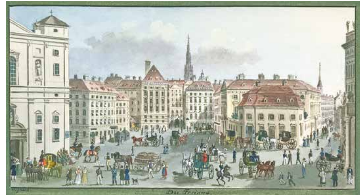
BALTHASAR WIGAND Wien 1771 – 1846 Felixdorf Reges Treiben auf der Freyung in Wien Aquarell auf Papier signiert und bezeichnet 9 x 17 cm