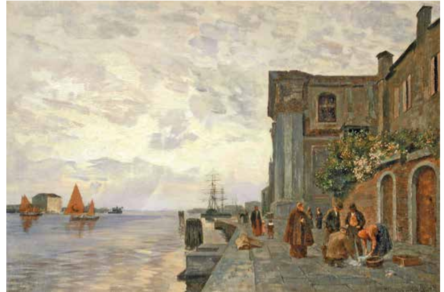
MAXIMILIAN SUPPANTSCHITSCH Wien 1865 – 1953 Dürnstein Spätnachmittag in Venedig bei der Kirche Santa Maria del Rosario (I Gesuati) Fondamente delle Zattere Öl auf Leinwand / Karton signiert, um 1890 42 x 64 cm