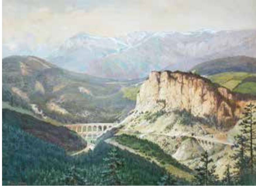
ERWIN PENDL Wien 1875 – 1945 Wien Blick auf die Semmeringbahn mit den Adlitzgräben und der Kalten Rinne, im Hintergrund die Rax Aquarell / Gouache auf Papier signiert und datiert 1902 64,5 x 85,5 cm