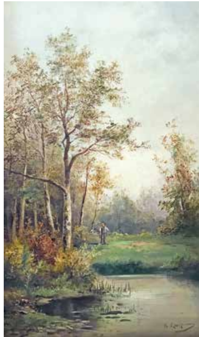
ADOLF KAUFMANN Troppau 1848 – 1916 Wien Landschaft mit Teich Öl auf Leinwand signiert 50,2 x 29 cm