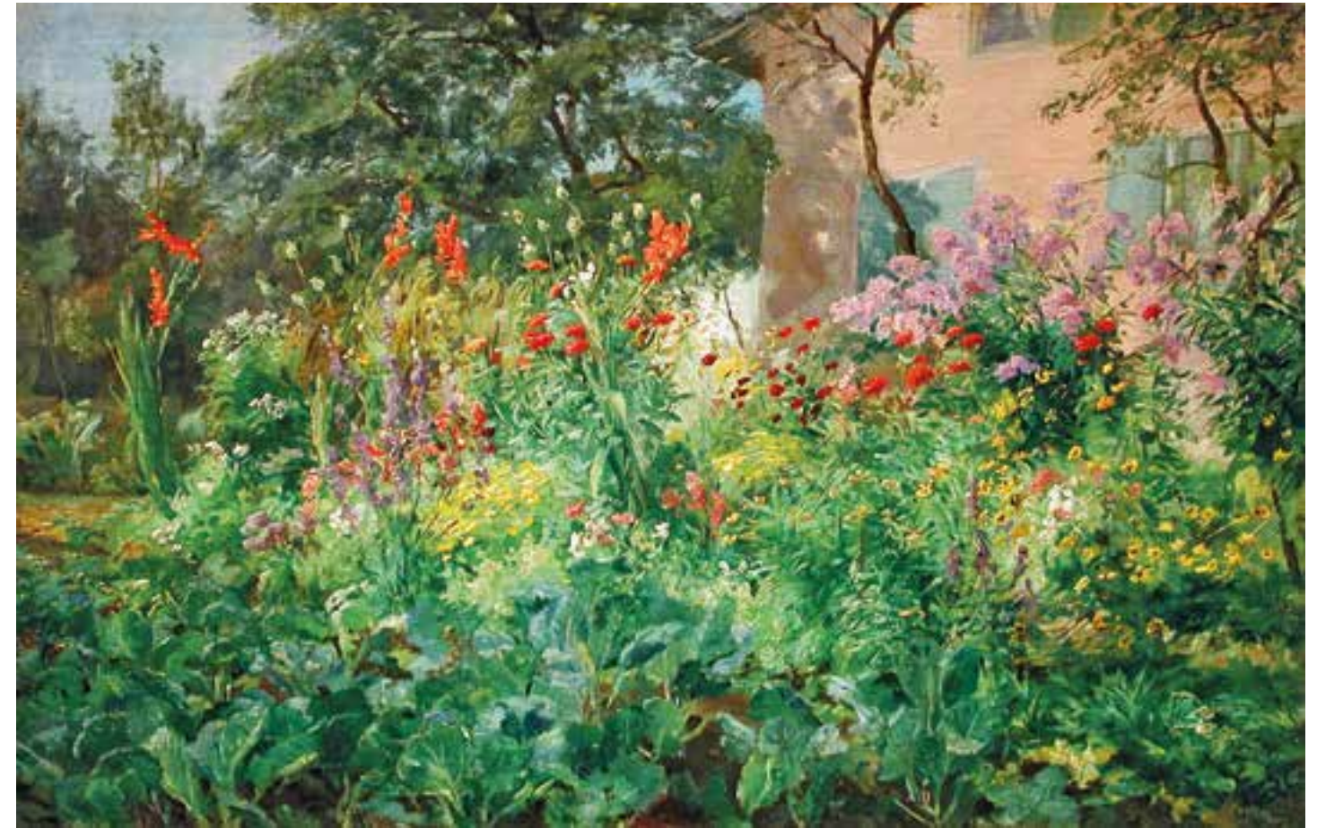
HUGO CHARLEMONT Jämnitz 1850 – 1939 Wien Ein Sommertag im Garten Öl auf Leinwand verso auf altem Klebeetikett bezeichnet 34 x 50 cm