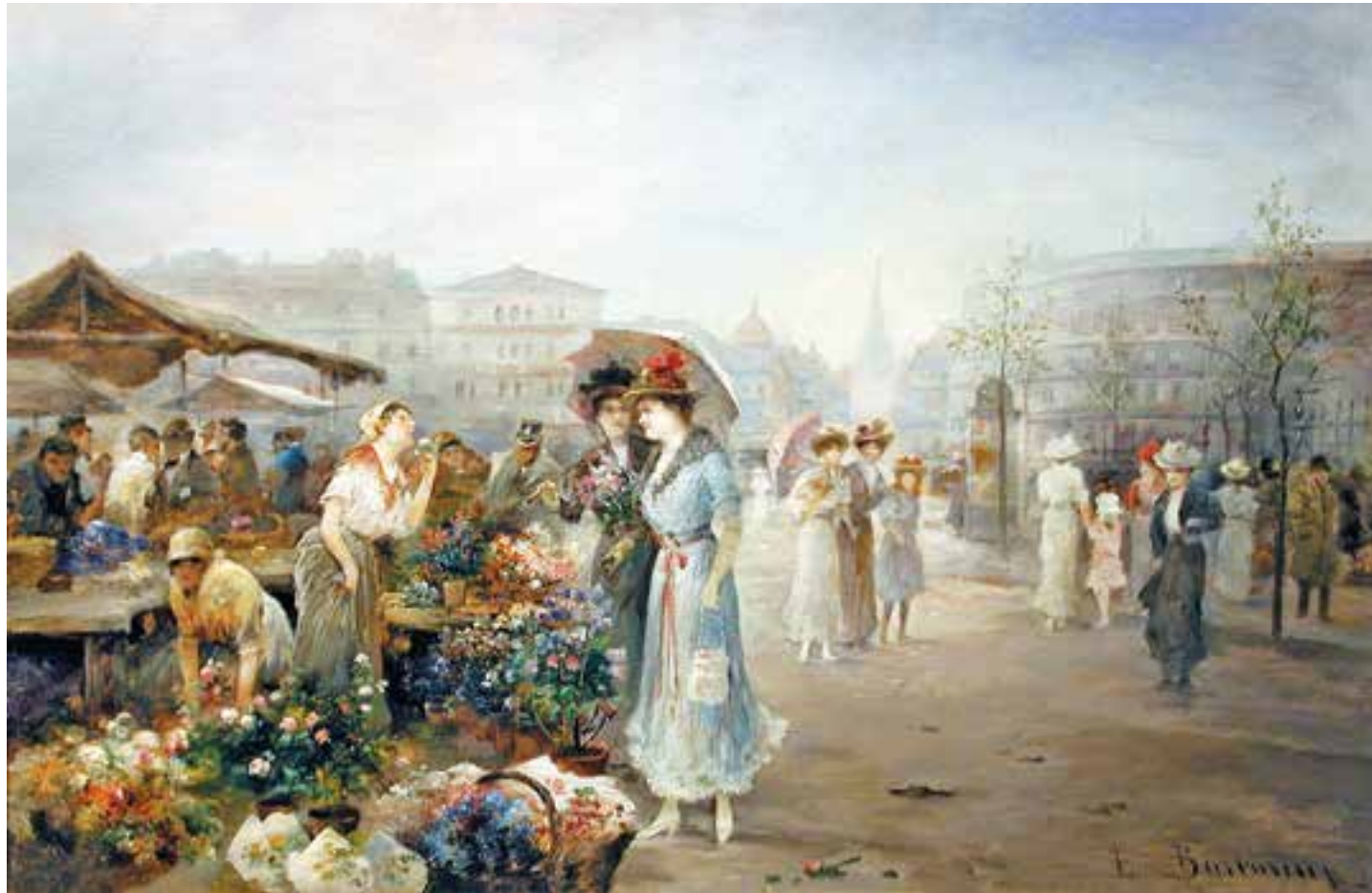
EMIL BARBARINI Wien 1855 – 1930 Wien Blumenmarkt in Wien mit Blick Richtung Stephansdom Öl auf Holz signiert 25,7 x 36,7 cm