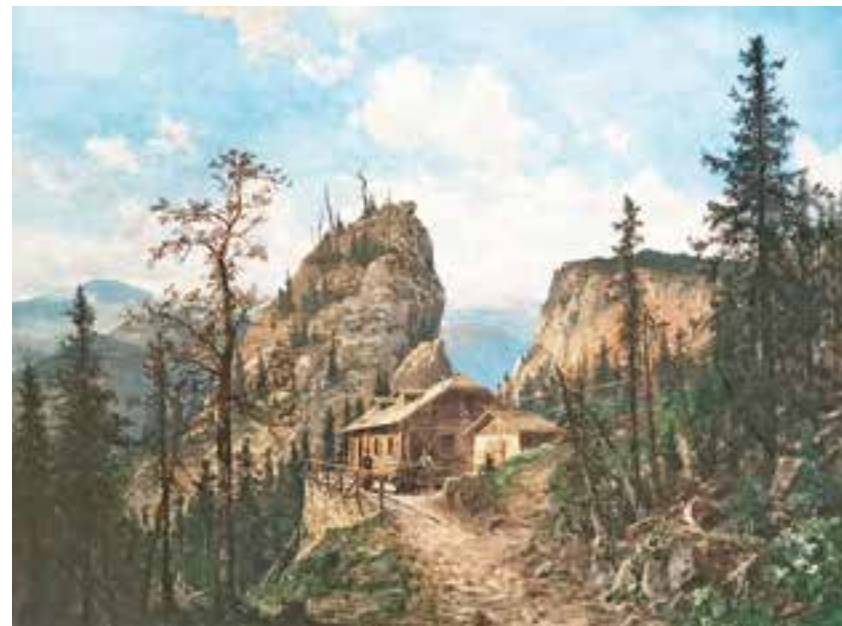
FERDINAND REMP Brünn 1870 – 1945 Wien Kientaler Hütte – Weichtalklamm im Höllental Mischtechnik auf Papier signiert und datiert 1900 44,5 x 60 cm