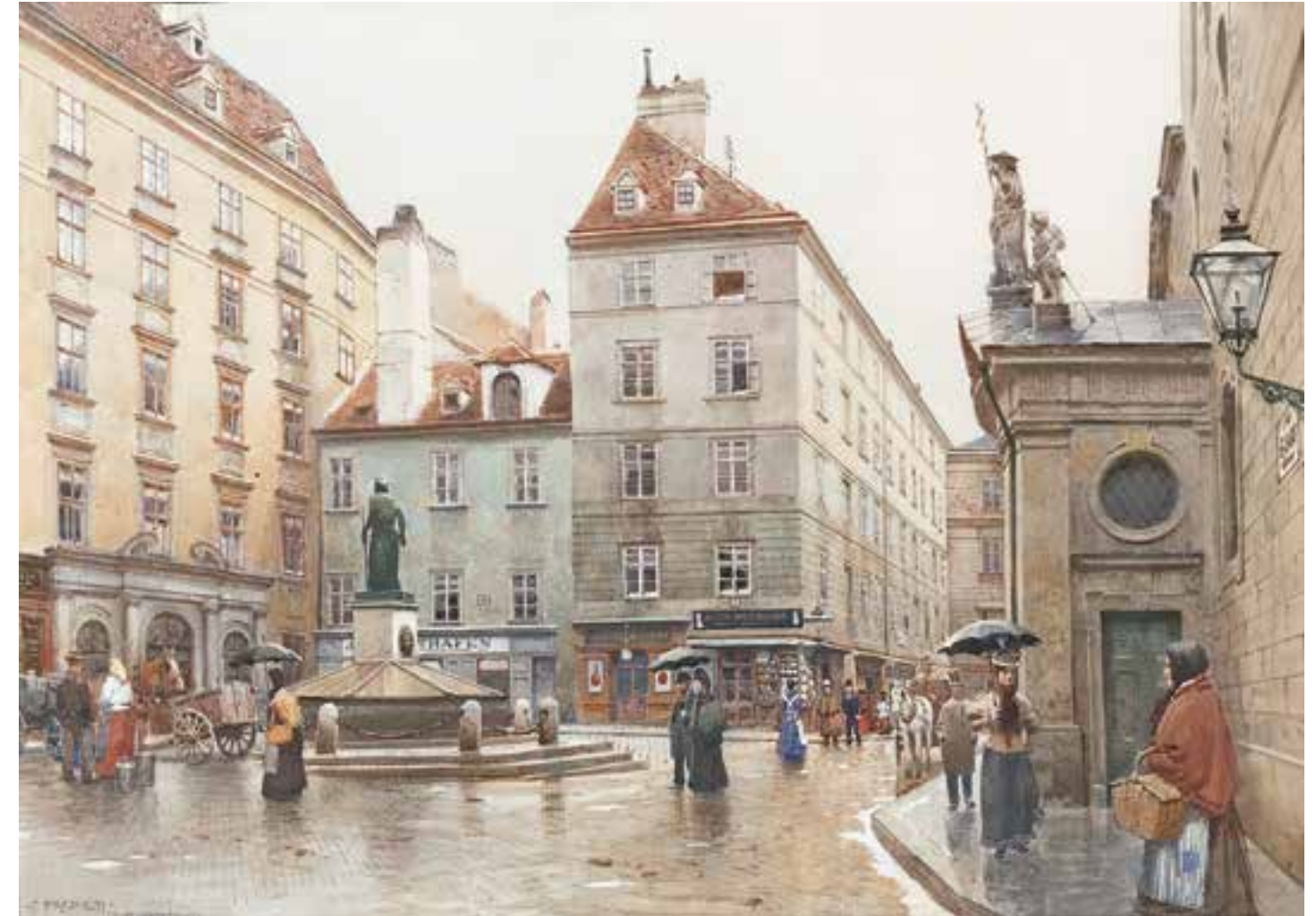
FRANZ POLEDNE Wien 1873 – 1932 Klosterneuburg Franziskanerplatz Aquarell auf Papier signiert und bezeichnet 27 x 38 cm