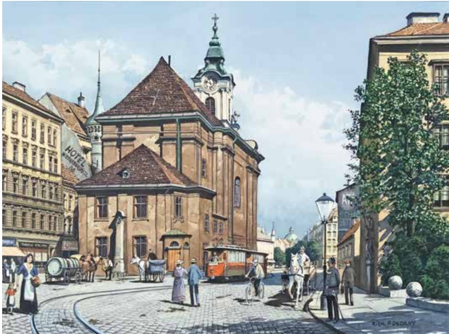
RICHARD POKORNY Wien 1907 – 1997 Wien Rauchfangkehrerkirche Aquarell / Gouache auf Papier signiert 27,5 x 37 cm