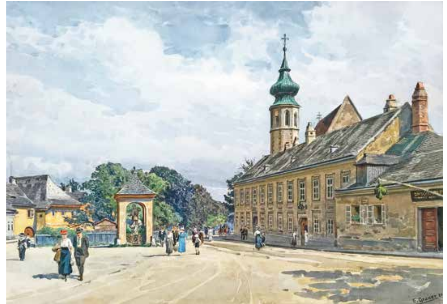
ERNST GRANER Werdau 1865 – 1943 Wien Sonntag in Grinzing Aquarell auf Papier signiert und datiert 1920 29,5 x 43 cm