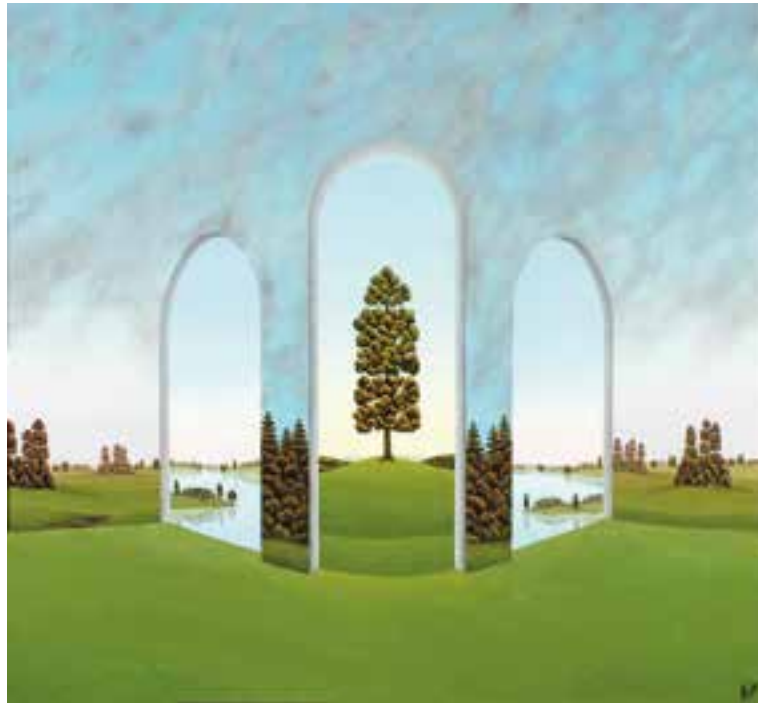
FRANZ POLITZER geboren 1950 Wien Der scheinbare Bogen Öl auf Platte signiert und datiert (20)17, verso bezeichnet 64,4 x 70,2 cm