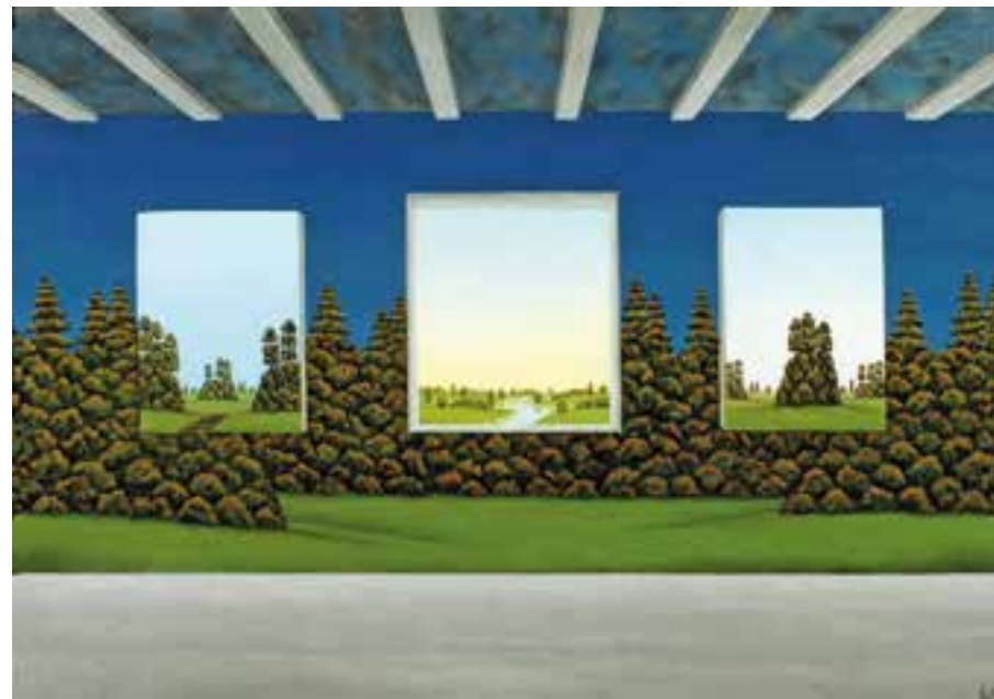
FRANZ POLITZER geboren 1950 Wien Der zentrale Ausblick Öl auf Platte signiert und datiert (20)20 verso bezeichnet 47,1 x 66,9 cm